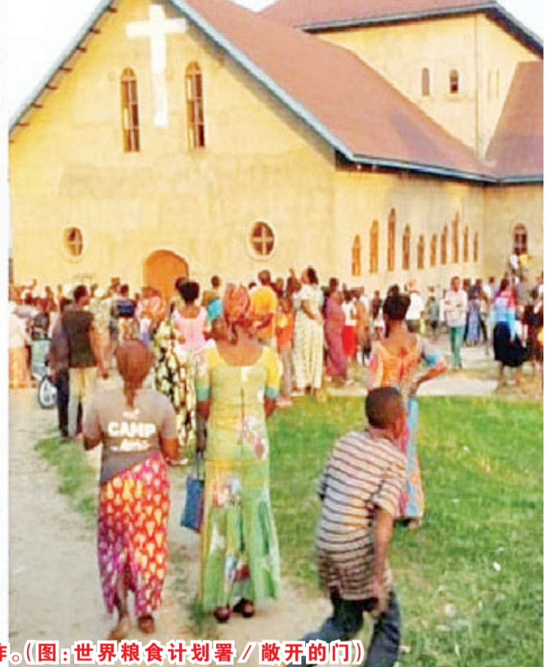
也门儿童、刚果东部贝尼市教堂连环爆炸。

中东地区长期陷于战争、种族清洗、饥荒人道危机。也门国内冲突7年造成25万人死亡、2,000万人活在贫穷线下;刚果民主共和国武装部队6月针对教堂发生连串爆炸。 也门2千万人缺医疗设施食水 也门为阿拉伯国家连续四年世界上最严重人道危机的国家,全